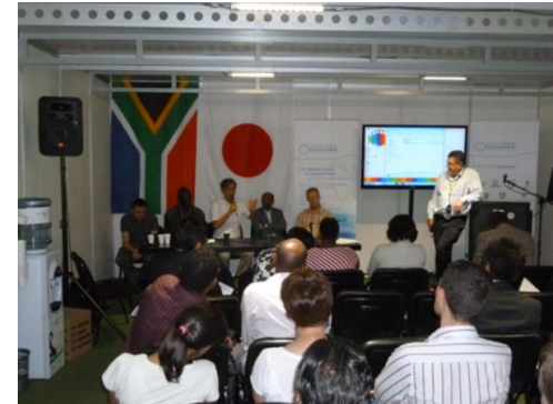
プロジェクトの成果発表（GOP17）

海洋研究開発機構（JAMSTEC）によるスーパーコンピュータ（「地球シミュレータ」）上の仮想地球を駆使し、異常気象の解明・予測に成功。同成果を活用し、日本の気候予測の精度向上、さらには、感染症流行予想モデルの開発及び早期警戒システムの構築にも貢献（別の技術協力案件として実施）。