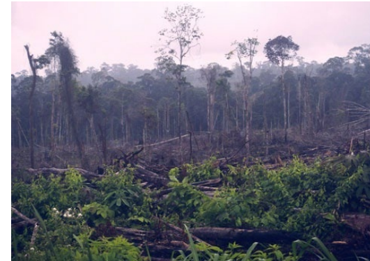
伐採後、燃やされたアマゾン熱帯雨林

JAXA、三菱電機等の技術を活用した「だいち2号」（ALOS-2）により、熱帯林にかかる雲を透過した地表の観測が可能となり、乾季・雨季に関係なく効果的なパトロールが実現。産総研によるAIを活用した改良型森林伐採予測システムも構築中。JICA-JAXA熱帯林早期警戒システム（JJ-FAST）は、ODAを通じてペルー等でも活用。